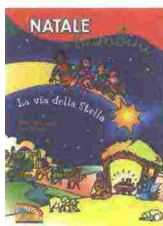
Gellini, A.M., Scarpa, M. (2007). La via della stella. Il Natale dei bambini. Bologna: Junior EDB

Usciamo nel quartiere per una passeggiata. Intorno a noi addobbi e luci: arriva Natale. Scopriamo nel Vangelo per chi i cristiani fanno festa il 25 dicembre e quale significato hanno i suoi segni.