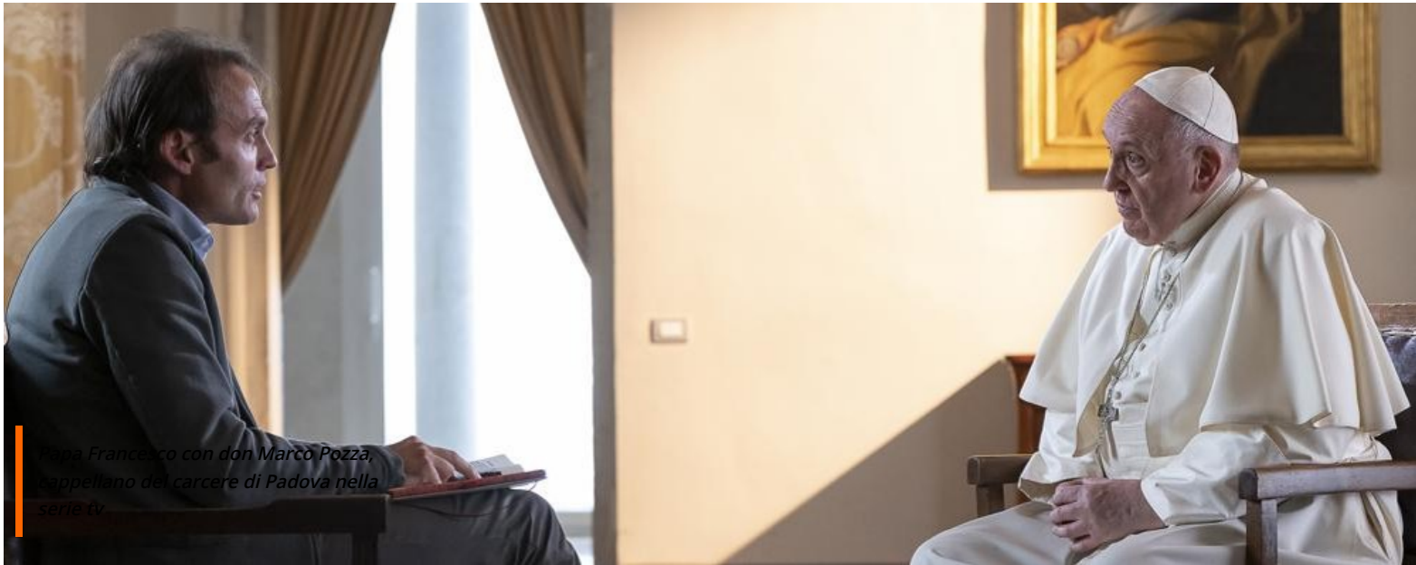
Papa Francesco con don Marco Pozza, cappellano del carcere di Padova nella serie tv